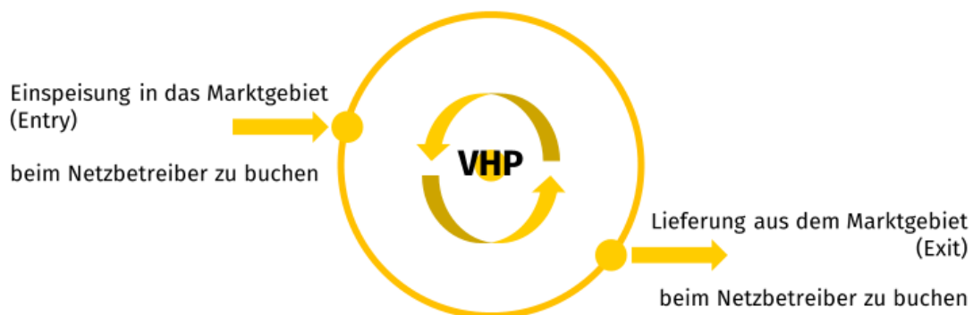
Abbildung: Grundlegendes Liefermodell der Gaswirtschaft

Unternehmen können Letztverbraucher (sowohl Tarif- als auch Gewerbe- und Industriekunden) in Deutschland auf Basis des sogenannten Entry-Exit-Modells (auch Zweivertragsmodell genannt) mit Erdgas versorgen. Bei diesem Modell speist der Lieferant Erdgas an einem beliebigen Einspeisepunkt in das Marktgebiet ein und an einem beliebigen Ausspeisepunkt wieder aus. Sowohl für die Einspeisung (Entry) als auch die Ausspeisung (Exit) sind beim jeweiligen Netzbetreiber Entgelte zu entrichten. Anstatt einer Einspeisung kann das Erdgas auch am virtuellen Handelspunkt (VHP) von einem Dritten bezogen werden. Für den Lieferanten ist bei diesem Modell unerheblich, wie lang der tatsächliche Transportweg zum Ausspeisepunkt ist und ob unterschiedliche Netzbetreiber beim Transport beteiligt sind. Er muss einzig mit dem Ausspeisenetzbetreiber einen Ausspeisevertrag schließen.