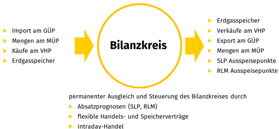
Abbildung: Prinzipielle Wirkweise eines Bilanzkreises

Als Bilanzkreis bezeichnet man ein virtuelles Mengenkonto für Erdgas, das den Handel am VHP des Marktgebietes mit der physischen Welt des Transport- und Verteilungsnetzes verbindet. Der Bilanzkreisverantwortliche ordnet Einspeisepunkte (Produzenten, Erdgasspeicher, Importe an Grenzübergangspunkten usw.), Handelsmengen am VHP (Käufe und Verkäufe) und Ausspeisepunkte (Kunden, Erdgasspeicher usw.) einem Bilanzkreis zu.